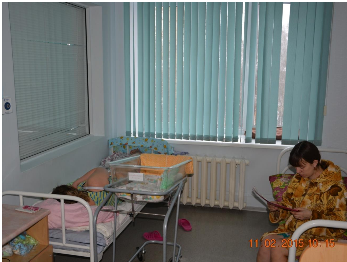
Палата совместного пребывания