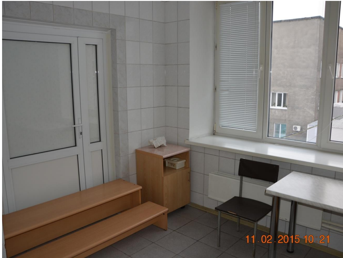
Комната для сцеживания