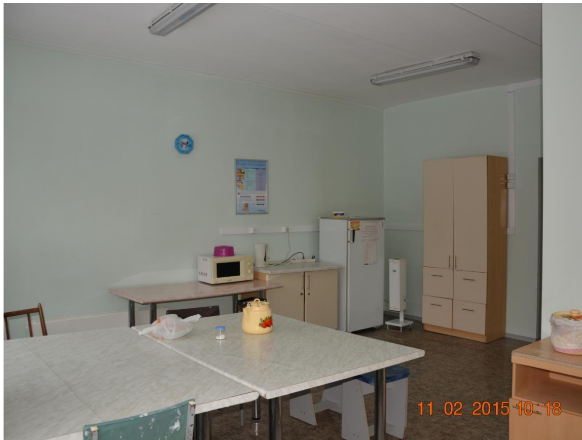
Столовая для мамочек