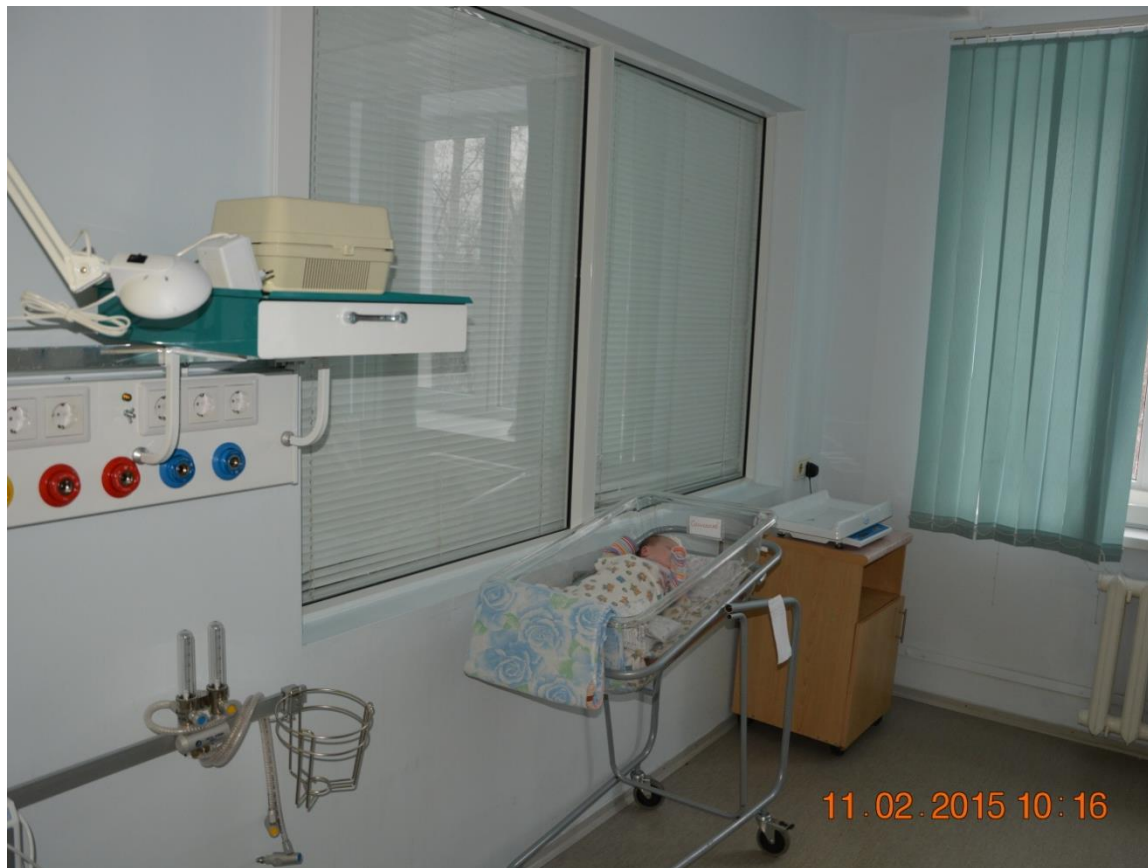
Общий вид палаты для новорожденных детей