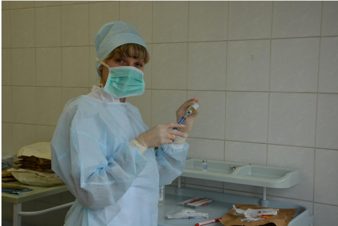
Работа процедурного кабинета