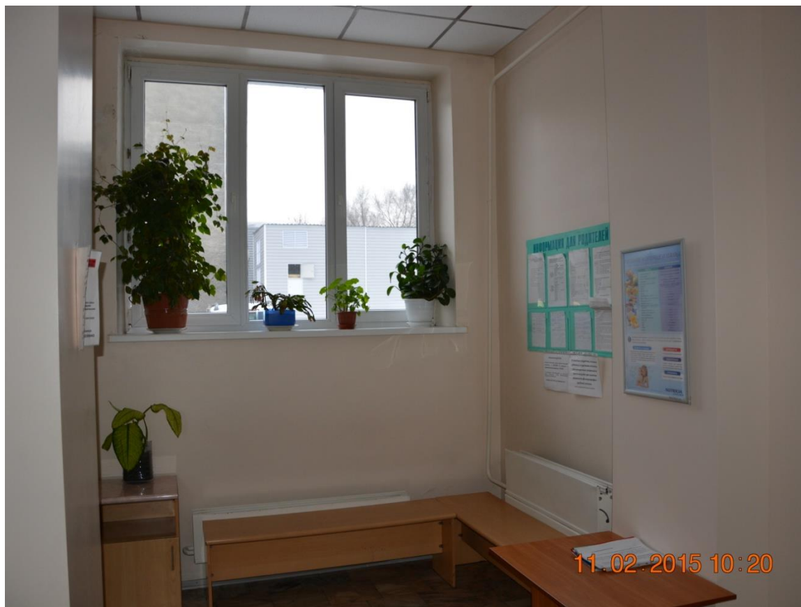
Холл для свиданий с родственниками